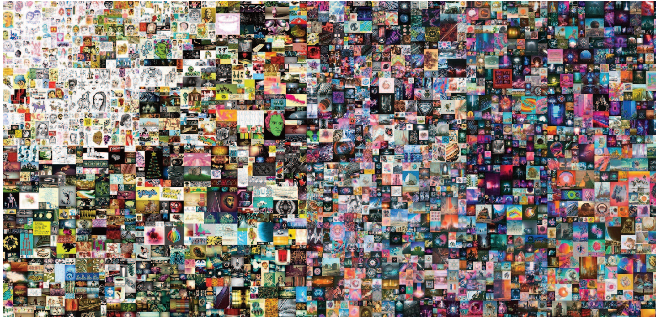
Mike Winkelmann (aka Beeple), Everyday: The First 5,000 Days, 2021