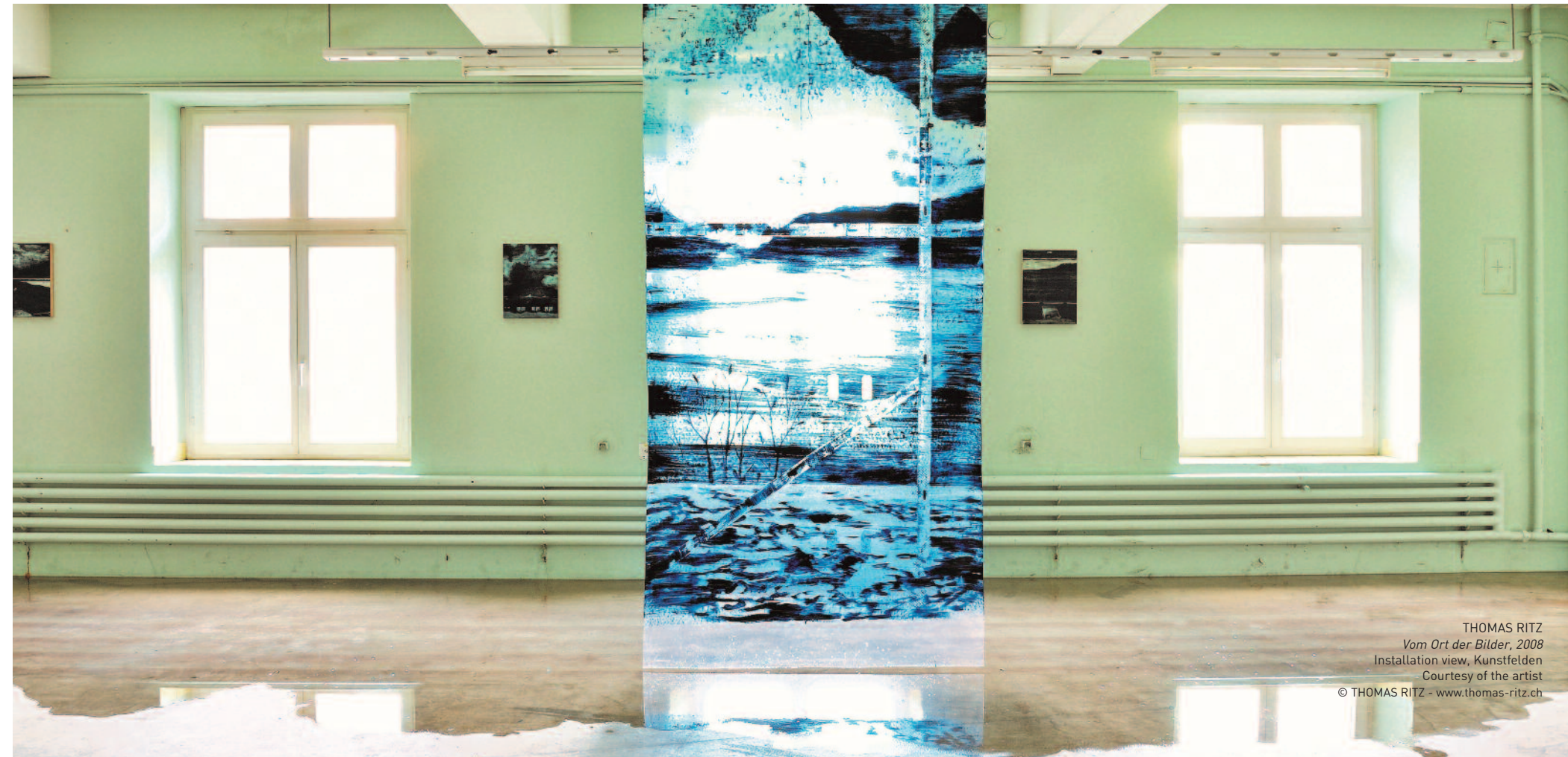
THOMAS RITZ Vom Ort der Bilder, 2008 Installation view, Kunstfeldern

Erwerb eines Kunstwerks oder die Beschaffung von Mitteln zur Diversifizierung Ihrer Finanzierungsquellen durch ein Darlehen im Gegenwert Ihrer Kunstsammlung handeln.