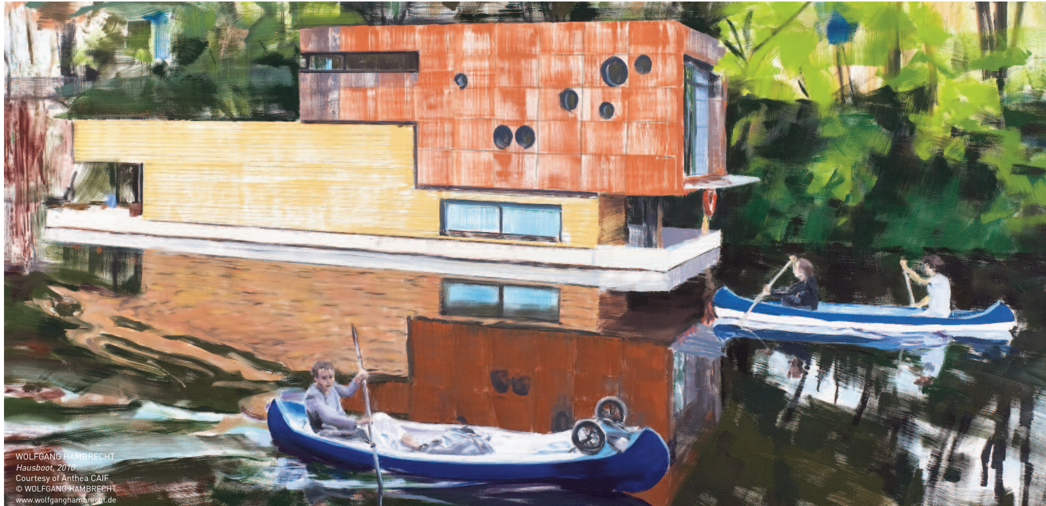
WOLFGANG HAMBRECHT Hausboot, 2010