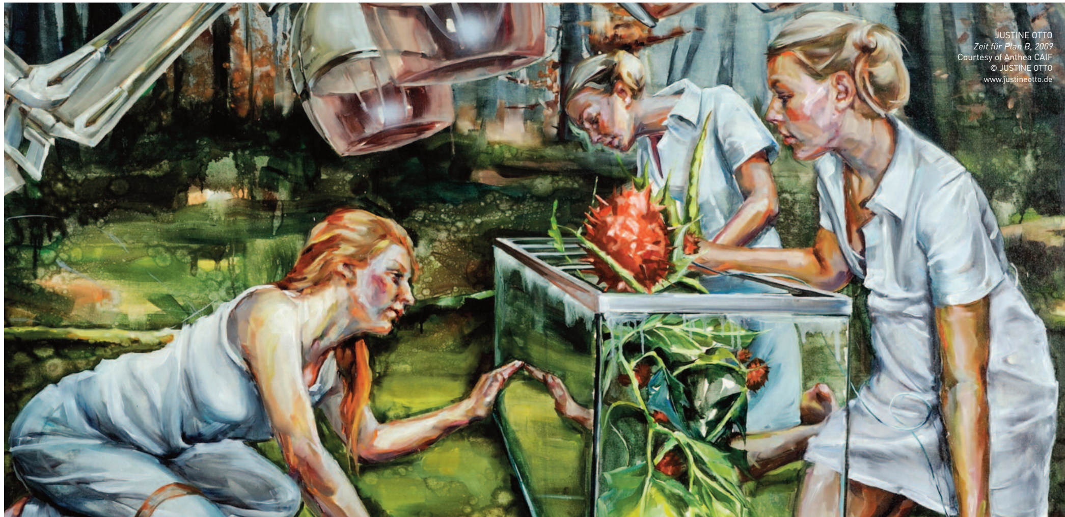
JUSTINE OTTO Zeit für Plan B, 2009

"Kunst sammeln ist ... eine Leidenschaft, die mit Disziplin verfolgt werden muss."