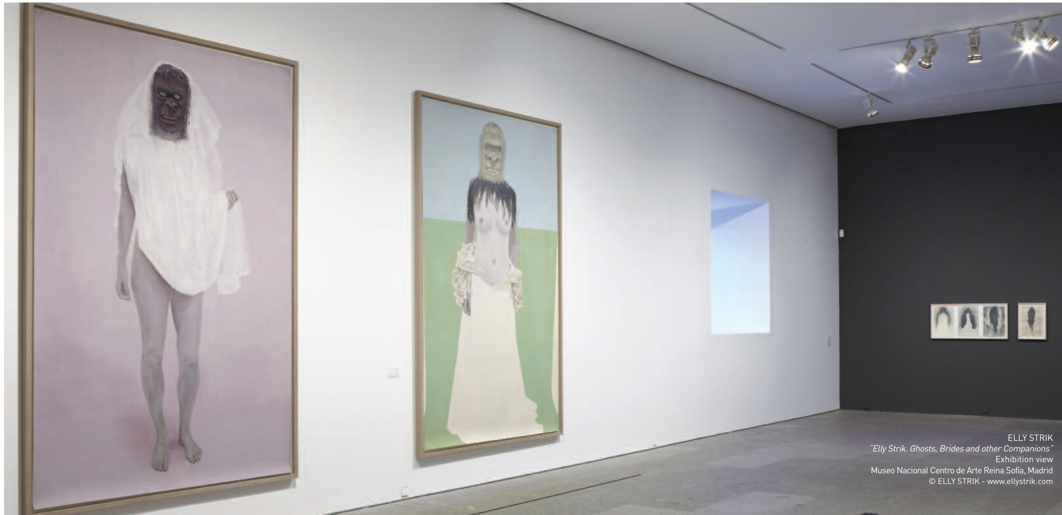
ELLY STRIK "Elly Strik. Ghosts, Brides and other Companions" Exhibition view Museo Nacional Centro de Arte Reina Sofía, Madrid © ELLY STRIK - www.ellystriik.com